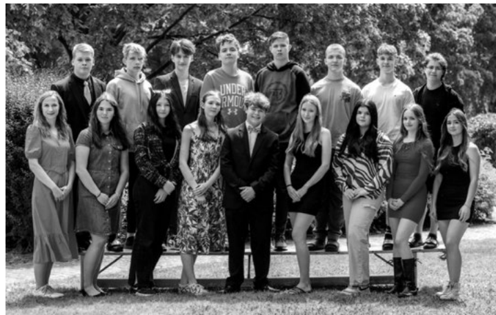
Absolventi IX. B