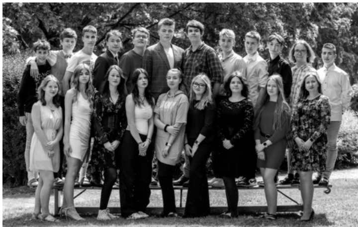
Absolventi IX. A